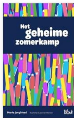
Marte Jongbloed Het geheime zomerkamp voor groep 3/4

https://blinkzomerlezen.nl/verhaal-maken