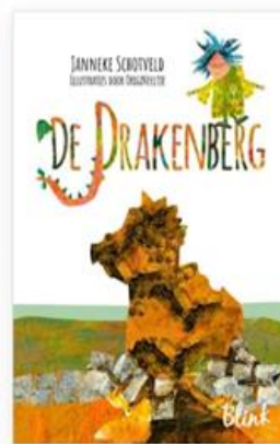
Janneke Schotveld De drakenberg voor groep 5/6